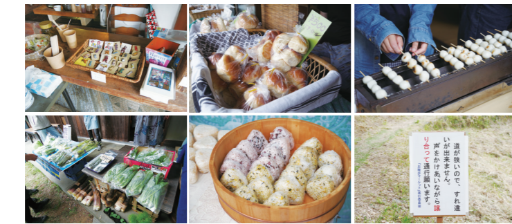
出品されるものは手作り! チラシやマップ、看板も手作り!

西武池袋線 飯能駅北口またはJR八高線 東飯能駅より国際興業バス「関野黒指(まのくろさず)行き」乗車