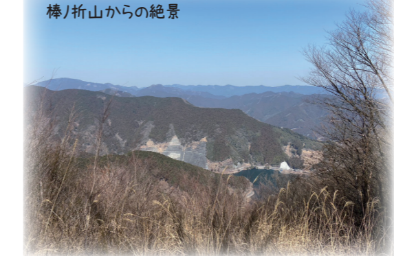
棒ノ折山からの絶景

奥武蔵と秩父の境に位置し、山並みがそびえ、その景観がアルプスに似ていることから、首都圏であるにも関わらずまるで遙か遠方に来たかのように感じさせてくれる。飯能市名栗に位置する有間ダムは、これまで西部地域に住む多くの人々の暮らしを支えてきた。今回は有間ダムの歴史や魅力、近隣の山を紹介する。