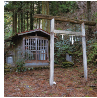
飯能市名栗浄水場の向かいにある祠。真新しい御幣に神殿内にはお神酒であるワンカップ酒が供されていました。またこちらではお申講が残っているそうです。

飯能市の山間部でたまに見かけるおサルさんもかつては山の神様とされていたようです。このような民俗信仰が盛んであった時代は、山の神様が住んでいる山を汚そうなどは誰も思わず、この自然が守られていたのではないかと思います。ただ現在では民俗信仰の衰退とともに講の数も減っていき、山中には朽ち果ててしまった祠もみられるそうです。自然に対する畏敬の念が薄まり、講などのコミュニケーションがなくなったことで個人的な損得勘定で山や川を汚す人が増えてしまったのではないかと感じます。