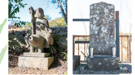
久遠カントリークラブ内に設置されている猪に乗った珍しい踏車地藏。 川寺にある庚申塔。「青面金剛」と足元には「見ザル聞かザル言わザル」の三猿が彫られている。

飯能市内には約一千もの石仏があると言われてます。市街地で見かけたことがある方も多いと思います。飯能市へのお出かけの目的に石仏探訪はいかがでしょう。