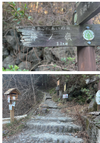
▲ 棒ノ折山登山道入り口

しばらくは般道が続くが、忽然と棒ノ折山の山道入り口が現れる。多くの岩場や鎖を使って登るような崖もあるが、それ以上に特筆すべき点は、やはり聳え立つ岩々であろう。睥睨するような岩が幾つもあり、その迫力には何度見ても圧倒される。また、山道に入りしほりへするや水のせせりぎや鳥のさえずりが聞こえてくる。相互交通が出来ないほど狭い山道であるが、耳を澄ませば、日常生活では味わえないような心の安らぎが訪れる。山道には有名なスポット