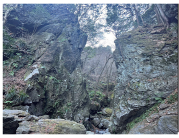
▲ 人を飲み込むようなゴルジユ帯は圧巻だ

ここまで有間ダムと棒ノ折山、下名栗の獅子舞について紹介してきた。一時、飯能市は木材の宝庫として隆盛を極め、非常に優れた木材が多くある町として有名であった。今でも、江戸時代から多くの人々に使われている西川材がある。今では木材よりも東京のベットタウンとしての街、と認識される傾向にあるが、江戸時代から現在までおよそ400年以上経った今でも豊富な木材資源や新緑が存在する。昨今の社会情勢の影響で、都心に住居を持つことが見直される今、飯能市の魅力をこそ、再発見する機会が訪れているのではないだろうか。