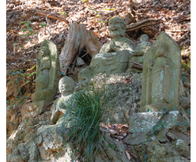
天覧山にある十六羅漢像