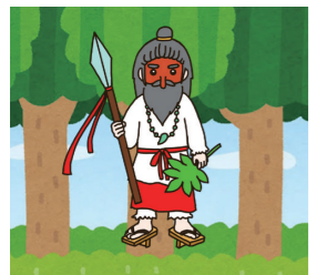
日本神話にも登場する『猿田彦命』天狗のような見た目ですが、天狗とは別なようです。 ※『命(ミコト)』は神様の敬称