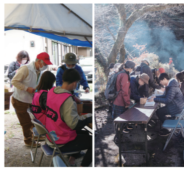
▲受付を担ってくれるボランティアスタッフの方々 (左:2023年5月・右:年2023年11月)

50年前ぐらいからこの土地を離れていく人が出てきて、その空き家に新しい住人が住みだした。それと「おしら講」という蚕の神を祭る行事。これは神様が書いてある掛け軸の前で、みんなで食べ物を持ち寄り女性だけで行うお祭り。皆さんが持ち寄るものが美味しかったので、これを他の方にも提供したい。いいんじゃないかという意見が新しく住みだした人たちから出たのがきっかけ。2003年に第1回目を開催し、口伝だけで100人以上集まった。